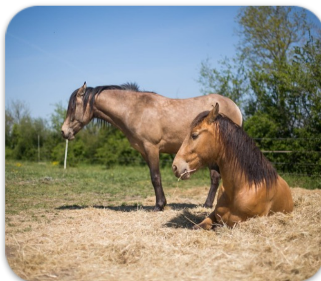
Ethologie, nutrition, naturopathie complémentaires au bien-être