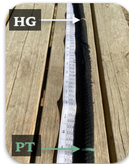
Lecture de HG et PT