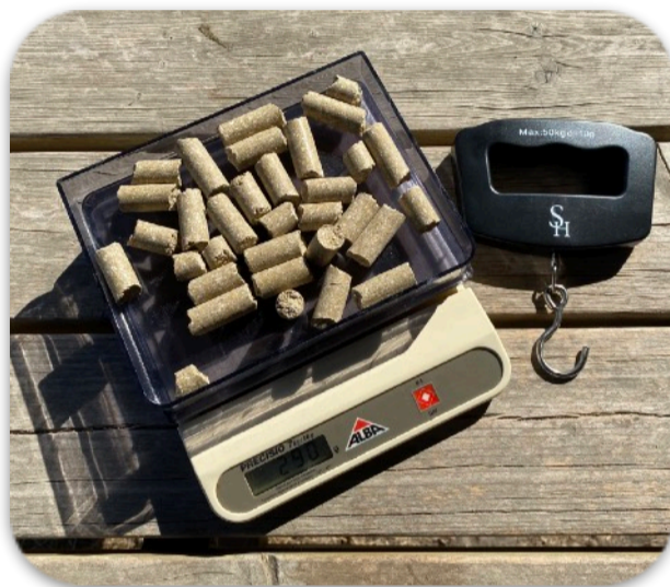
Balance pour grain et foin

Que vous utilisiez une pelle à grain ou une autre mesure, je vous recommande de peser les quantités que vous avez l'habitude de donner. Le calcul de ration sera plus précis.