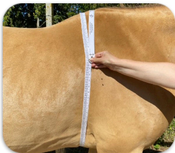
Méthode classique pour PT Lecture directe

Méthode maison : longe avec un élastique pour marquer PT