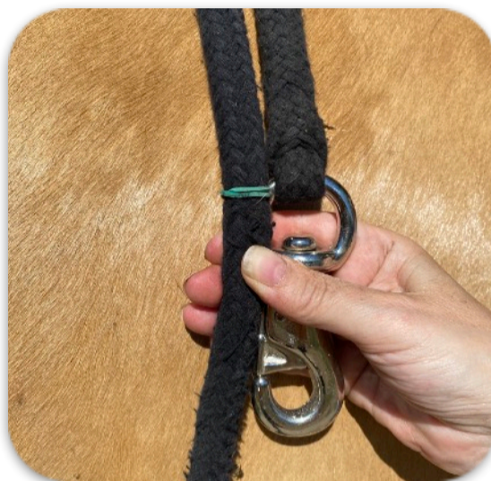
Méthode maison pour PT Lecture reportée