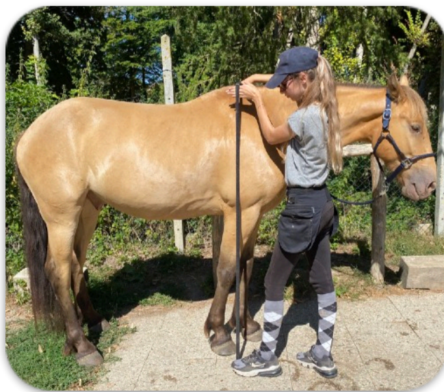
Méthode maison pour toiser

Méthode maison : longe avec le pied sur le mousqueton, un élastique pour noter HG